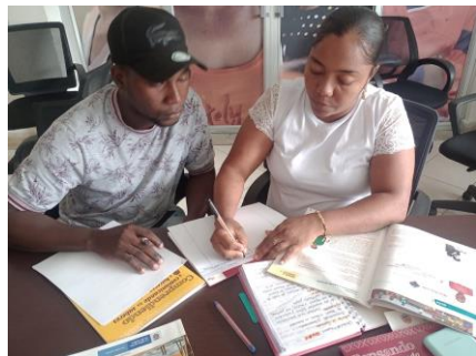
Formación docente y entrega de 6 kits.