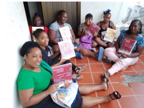
Entrega de módulos Etnoeducativo para comunidades negras del pacífico colombiano

Modelo Educativo Flexible “Modelo Etnoeducativo para comunidades negras del Pacífico Colombiano”.